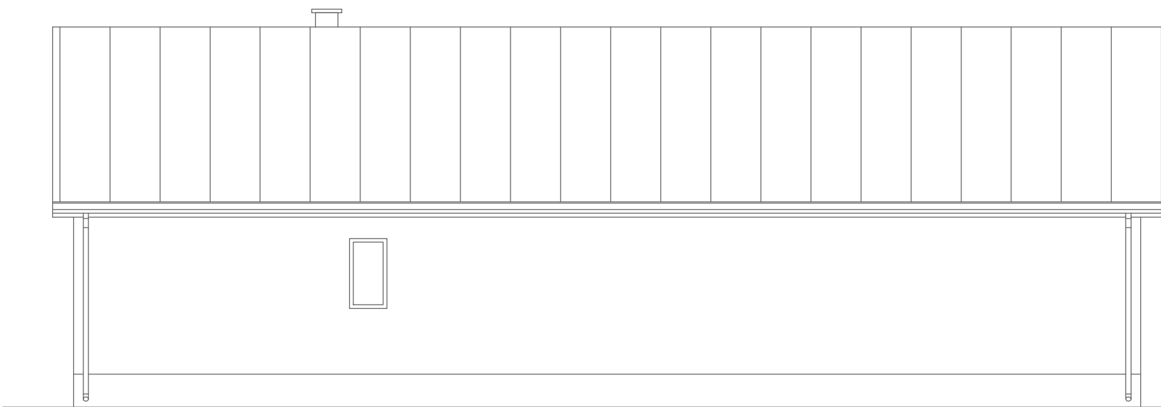
ELEWACJA ZACHODNIA 1:100